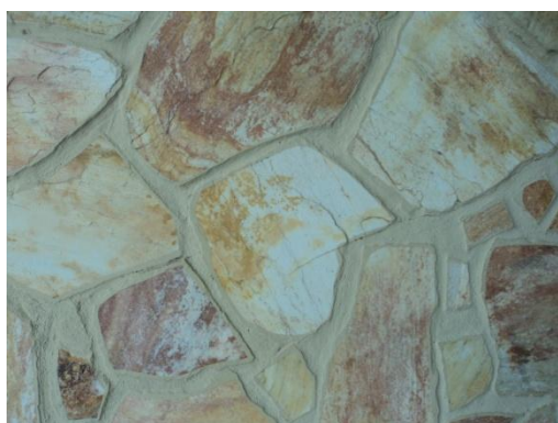
Pará de Minas – Antigo Asilo Padre José Pereira Coelho, atual Faculdade de Pará de Minas – Fapam. Detalhe do revestimento externo (foto 08) – 26/11/2013