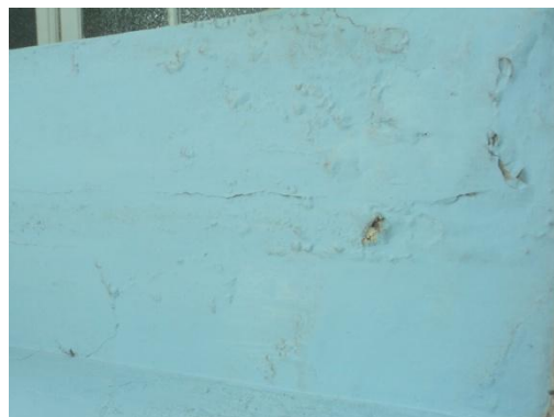
Pará de Minas - Antigo Asilo Padre José Pereira Coelho, atual Faculdade de Pará de Minas – Fapam. Pintura da fachada (foto 11) Imagem: Rangele Lúcia de Faria – 26/11/2013