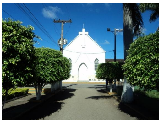
Pará de Minas - Antigo Asilo Padre José Pereira Coelho, atual Faculdade de Pará de Minas – Fapam. Vista do jardim (foto 23) Imagem: Rangele Lúcia de Faria – 26/11/2013