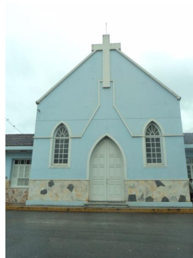
Pará de Minas - Antigo Asilo Padre José Pereira Coelho, atual Faculdade de Pará de Minas – Fapam. Vista frontal (foto 03) Imagem: Rangele Lúcia de Faria – 26/11/2013