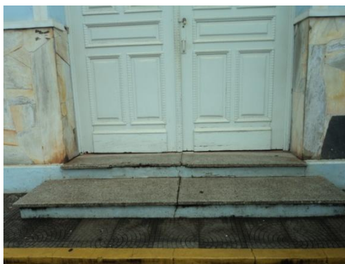
Pará de Minas - Antigo Asilo Padre José Pereira Coelho, atual Faculdade de Pará de Minas – Fapam. Degraus na entrada da igreja (foto 18) Imagem: Rangele Lúcia de Faria – 26/11/2013