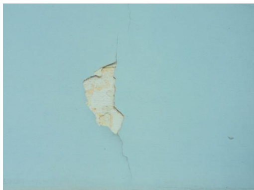
Pará de Minas - Antigo Asilo Padre José Pereira Coelho, atual Faculdade de Pará de Minas – Fapam. Pintura da fachada (foto 10) Imagem: Rangele Lúcia de Faria – 26/11/2013