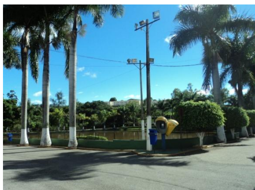
Pará de Minas - Antigo Asilo Padre José Pereira Coelho, atual Faculdade de Pará de Minas – Fapam. Vista da lagoa e jardim (foto 22) Imagem: Rangele Lúcia de Faria – 26/11/2013