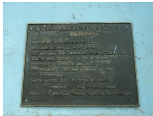
Pará de Minas - Antigo Asilo Padre José Pereira Coelho, atual Faculdade de Pará de Minas – Fapam. Placa de identificação (foto 05) – 26/11/2013