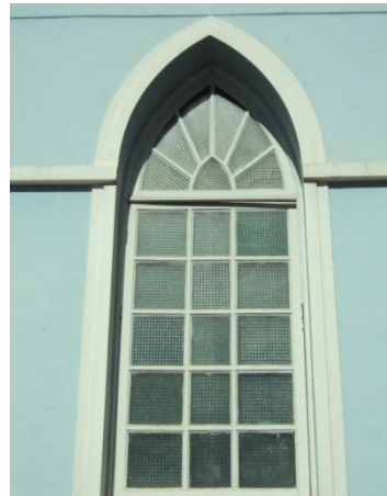
Pará de Minas - Antigo Asilo Padre José Pereira Coelho, atual Faculdade de Pará de Minas – Fapam. Janela em bom estado de conservação (foto 15) Imagem: Rangele Lúcia de Faria – 26/11/2013