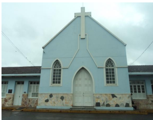
Pará de Minas - Antigo Asilo Padre José Pereira Coelho, atual Faculdade de Pará de Minas – Fapam. Fachada frontal (foto 04) Imagem: Rangele Lúcia de Faria – 26/11/2013