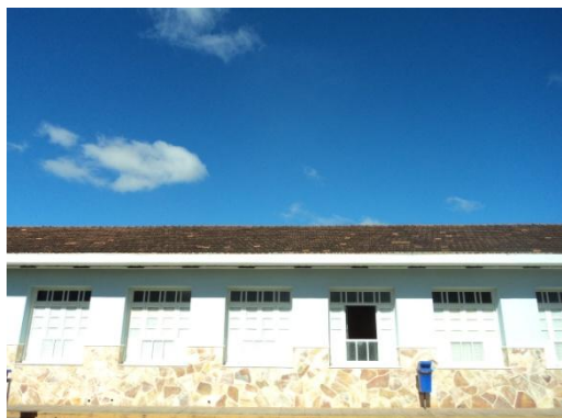
Pará de Minas - Antigo Asilo Padre José Pereira Coelho, atual Faculdade de Pará de Minas – Fapam. Alvenaria em bom estado de conservação (foto 06) Imagem: Rangele Lúcia de Faria – 26/11/2013