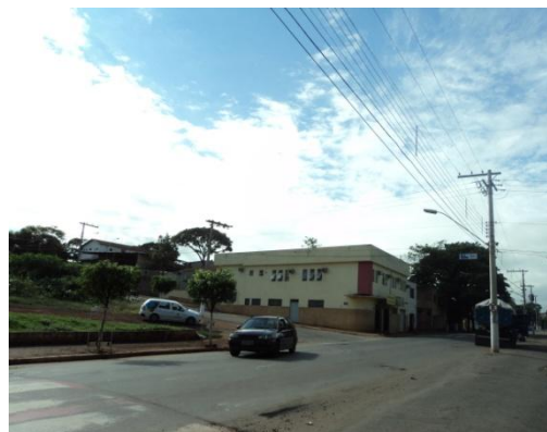
Par  de Minas - Antigo Asilo Padre Jos  Pereira Coelho, atual Faculdade de Par  de Minas – Fapam. Entorno (foto 26) Imagem: Rangele L cia de Faria – 26/11/2013