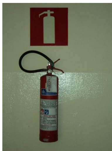
Pará de Minas - Antigo Asilo Padre José Pereira Coelho, atual Faculdade de Pará de Minas – Fapam. Presença de extintor de incêndio (foto 24) 26/11/2013