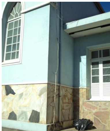
Pará de Minas - Antigo Asilo Padre José Pereira Coe atual Faculdade de Pará de Minas – Fapam. Janela fachada frontal (foto 14) Imagem: Rangele Lúcia de Faria – 26/11/2013