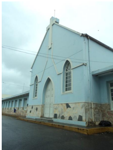
Pará de Minas - Antigo Asilo Padre José Pereira Coelho, atual Faculdade de Pará de Minas – Fapam. Vista frontal (foto 02) Imagem: Rangele Lúcia de Faria – 26/11/2013