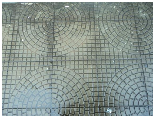
Pará de Minas - Antigo Asilo Padre José Pereira Coelho, atual Faculdade de Pará de Minas – Fapam. Passeio (foto 20) 26/11/2013