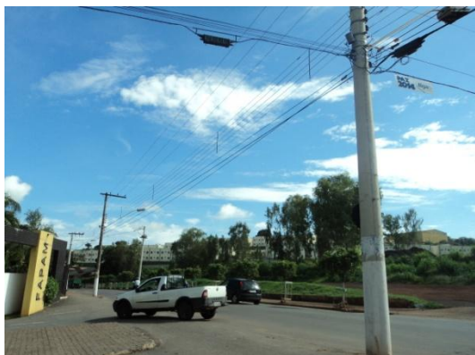
Par  de Minas - Antigo Asilo Padre Jos  Pereira Coelho, atual Faculdade de Par  de Minas – Fapam. Entorno (foto 25) Imagem: Rangele L cia de Faria – 26/11/2013