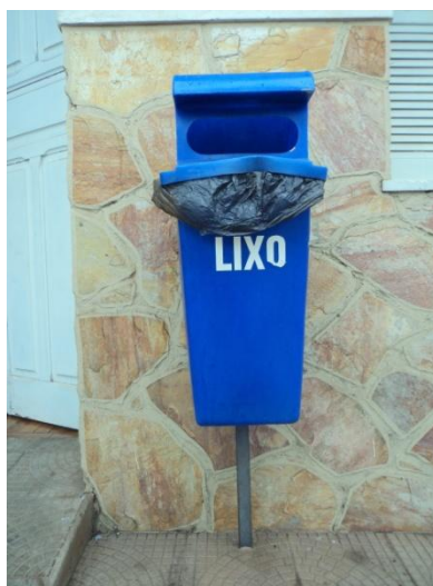
Pará de Minas - Antigo Asilo Padre José Pereira Coelho, atual Faculdade de Pará de Minas – Fapam. Lixeira (foto 21) 26/11/2013