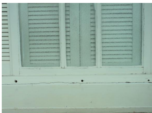
Pará de Minas - Antigo Asilo Padre José Pereira Coelho, atual Faculdade de Pará de Minas – Fapam. Detalhe da janela com fissura na madeira (foto 12) Imagem: Rangele Lúcia de Faria – 26/11/2013