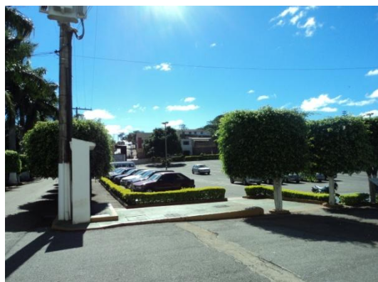
Pará de Minas - Antigo Asilo Padre José Pereira Coelho atual Faculdade de Pará de Minas – Fapam. Asfalto do estacionamento (foto 19) Imagem: Rangele Lúcia de Faria – 26/11/2013