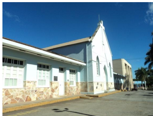
Pará de Minas - Antigo Asilo Padre José Pereira Coelho, atual Faculdade de Pará de Minas – Fapam. Alvenaria em bom estado de conservação (foto 07) Imagem: Rangele Lúcia de Faria – 26/11/2013