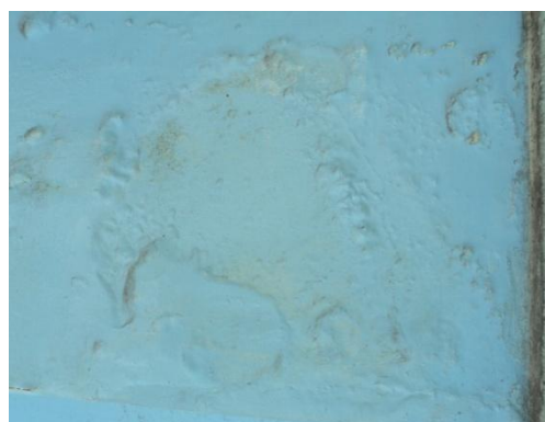
Pará de Minas – Antigo Asilo Padre José Pereira Coelho, atual Faculdade de Pará de Minas – Fapam. Fachada externa com danos no revestimento (foto 09) Imagem: Rangele Lúcia de Faria – 26/11/2013