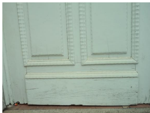
Pará de Minas - Antigo Asilo Padre José Pereira Coelho, atual Faculdade de Pará de Minas – Fapam. Detalhe da porta de entrada da igreja (foto 17) Imagem: Rangele Lúcia de Faria – 26/11/2013