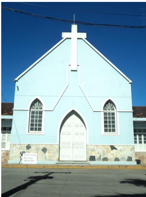
Pará de Minas - Antigo Asilo Padre José Pereira Coelho, atual Faculdade de Pará de Minas – Fapam. Fachada frontal (foto 01)

EM CASO POSITIVO: LEI FEDERAL LEI ESTADUAL OUTRA