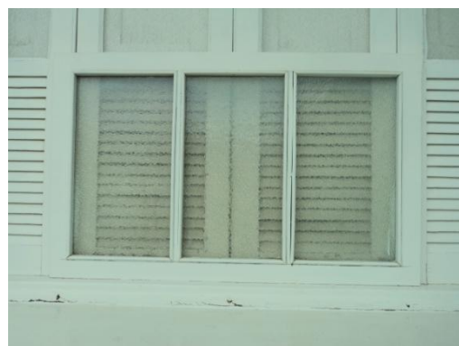
Pará de Minas - Antigo Asilo Padre José Pereira Coelho, atual Faculdade de Pará de Minas – Fapam. Vista da janela (foto 13) Imagem: Rangele Lúcia de Faria – 26/11/2013