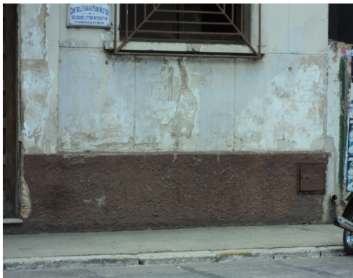
Pará de Minas - Centro Literário Pedro Nestor Detalhe do descolamento da pintura e trincas (foto 10)