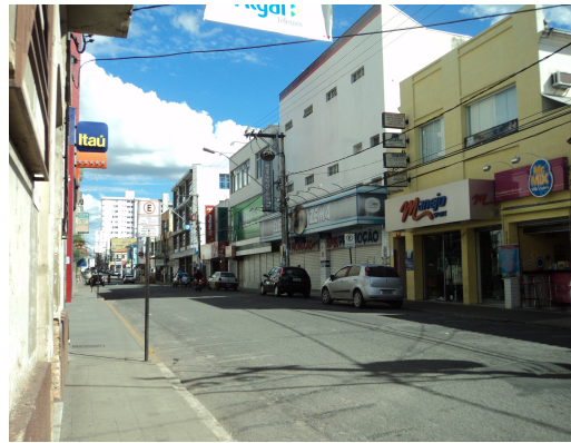
Pará de Minas - Centro Literário Pedro Nestor