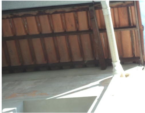
Pará de Minas - Centro Literário Pedro Nestor