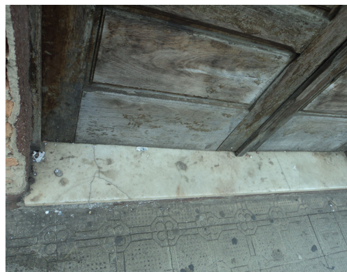
Pará de Minas - Centro Literário Pedro Nestor Vista da soleira (foto 19) Imagem: Isabel Garcia-15/11/20113