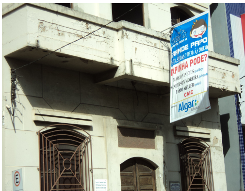
Pará de Minas - Centro Literário Pedro Nestor Vista da sacada (foto 20) Imagem: Isabel Garcia-15/11/2013