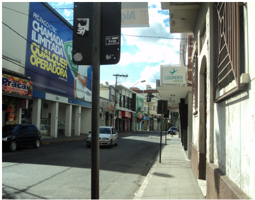
Pará de Minas - Centro Literário Pedro Nestor

Vista da rua Benedito Valadares (foto26)