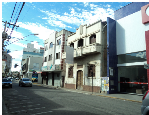
Par  de Minas - Centro Liter rio Pedro Nestor Edifica es da lateral esquerda (foto 25) Imagem: Isabel Garcia-15/11/2013