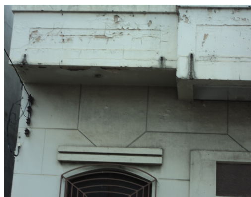
Pará de Minas - Centro Literário Pedro Nestor Detalhe da pintura e elemento artístico (foto 12)