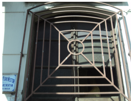
Pará de Minas - Centro Literário Pedro Nestor Detalhe da perda do vidro(foto 16) Imagem: Isabel Garcia-15/11/2013