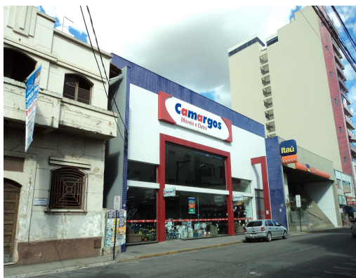
Par  de Minas - Centro Liter rio Pedro Nestor Edifica es da lateral direita (foto 24) Imagem: Isabel Garcia-15/11/2013