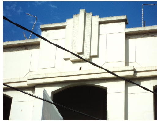
Pará de Minas -Centro Literário Pedro Nestor Detalhe do elemento artístico (foto 11)