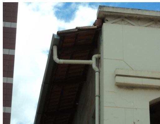
Pará de Minas - Centro Literário Pedro Nestor Detalhe da calha e condutores (foto 06)