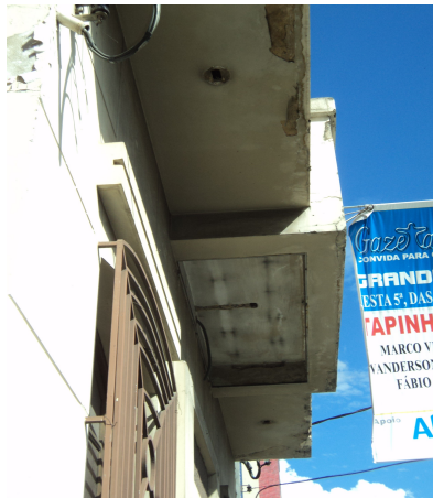
Pará de Minas - Centro Literário Pedro Nestor Retirada das luminárias (foto 23) Imagem: Isabel Garcia-15/11/2013