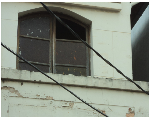
Pará de Minas - Centro Literário Pedro Nestor Detalhe da perda do vidro (foto 15) Imagem: Isabel Garcia-15/11/2013