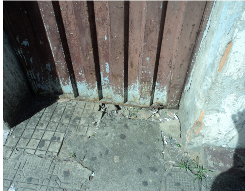
Pará de Minas - Centro Literário Pedro Nestor Perda e remendo do passeio (foto 22) 15/11/2013