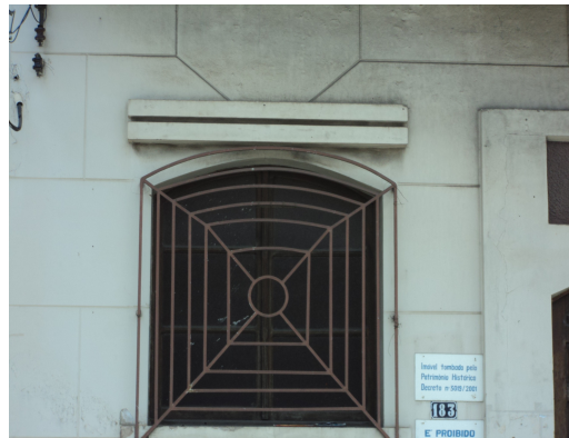
Pará de Minas - Centro Literário Pedro Nestor Vista da janel(foto 14) Imagem: Isabel Garcia-15/11/213