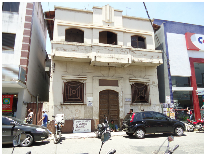
Pará de Minas - Centro Literário Pedro Nestor

EM CASO POSITIVO: LEI FEDERAL LEI ESTADUAL OUTRA