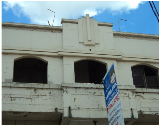
Pará de Minas - Centro Literário Pedro Nestor Vista da platibanda (foto 05)-15/11/2013