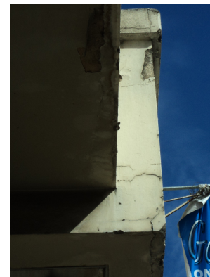
Pará de Minas - Centro Literário Pedro Nestor Detalhe da preda de material (foto 21) Imagem: Isabel Garcia-15/11/2013