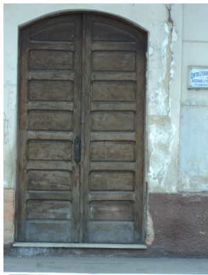
Pará de Minas - Centro Literário Pedro Nestor Vista da porta (foto 13) Imagem: Isabel Garcia-15/11/2013

Obs: A edificação está sendo reformada, mas as obras estão paralisadas.