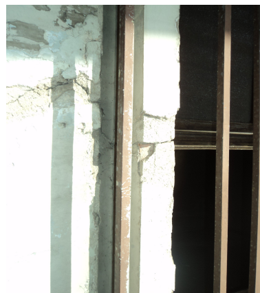
Pará de Minas - Centro Literário Pedro Nestor Detalhe das trincas e rachaduras (foto 04) Imagem: Isabel Garcia-15/11/20113