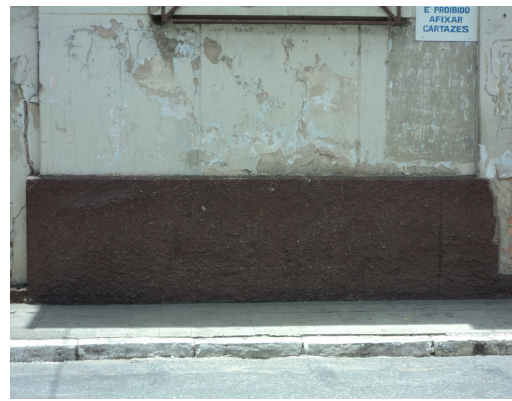
Pará de Minas - Centro Literário Pedro Nestor Vista das rachaduras e trincas (foto 03) 15/11/2013