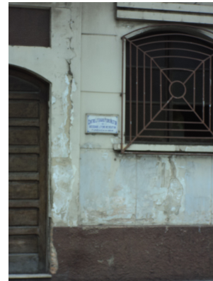
Pará de Minas -Centro Literário Pedro Nestor Detalhe descolamento da pintura (foto 09)