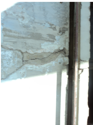
Pará de Minas - Centro Literário Pedro Nestor Detalhe da rachadura (foto 02) Imagem: Isabel Garcia-15/11/2013

Obs: A edificação está sendo reformada,mas as obras estão paralizadas.