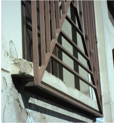
Pará de Minas - Centro Literário Pedro Nestor Detalhe da grade da janela (foto 17) Imagem: Isabel Garcia-15/11/2013