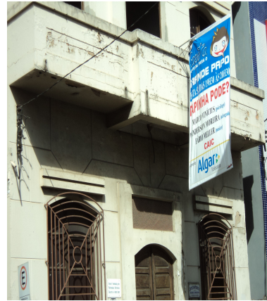
Pará de Minas - Centro Literário Pedro Nestor Detalhe do enquadramento da porta (foto 18)15/11/2013