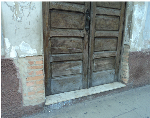
Pará de Minas - Centro Literário Pedro Nestor Perda de reboco (foto 08)