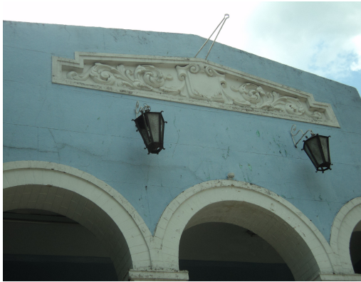
Pará de Minas - E. E. Governador Valadares Detalhe platibanda (foto 04) Imagem: Isabel Garcia-12/11/2013