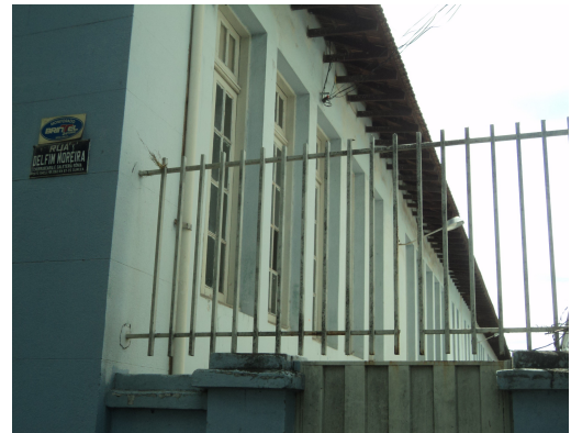
Pará de Minas - E. E. Governador Valadares

Vista do pilar e fachada direita (foto 03)