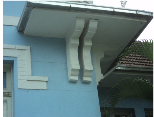
Pará de Minas - E. E. Governador Valadares Detalhe das telhas, calhas e beiral (foto 05) Imagem: Isabel Garcia-12/11/2013