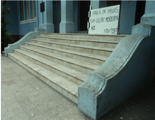
Pará de Minas - E. E. Governador Valadares Escada em mármore (foto 24)12/11/2013