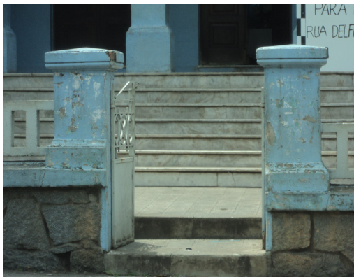
Pará de Minas - E. E. Governador Valadares Detalhe da perda de material e pintura (foto30) Imagem: Isabel Garcia-12/11/2013