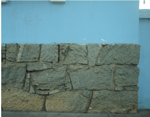
Pará de Minas - E. E. Governador Valadares Pintura e revestimento com sujidades(foto11)12/11/2013