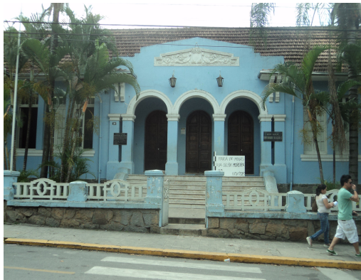
Pará de Minas - E. E. Governador Valadares