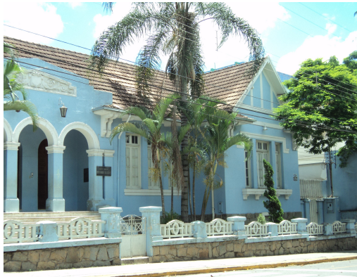
Pará de Minas - E. E. Governador Valadares Vista das árvores e gradil (foto 28) Imagem: Isabel Garcia-12/11/2