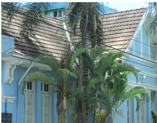
Pará de Minas - E. E. Governador Valadares Vista do telhado (foto 08) Imagem: Isabel Garcia-12/11/2013