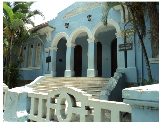
Pará de Minas - E. E. Governador Valadares Varanda(foto 27) Imagem: Isabel Garcia-12/11/2013