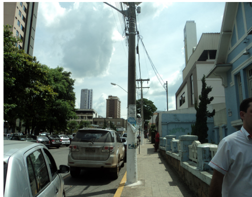
Pará de Minas - E. E. Governador Valadares Vista do área central da cidade (foto 34)12/11/20113