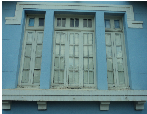
Pará de Minas - E. E. Governador Valadares Vista do Detalhe da janela com descolamento da pintura(foto16) Imagem: Isabel Garcia-12/11/2013