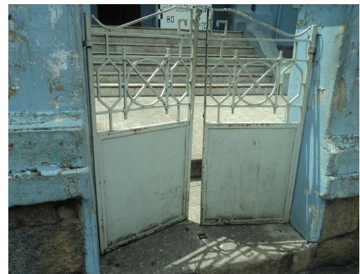
Pará de Minas - E. E. Governador Valadares Portão metálico na fachada (foto31) Imagem: Isabel Garcia-12/11/2013