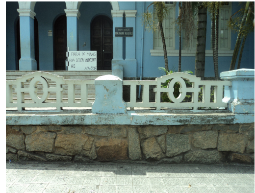
Pará de Minas - E. E. Governador Valadares Detalhe gradil na fachada (foto 29) Imagem: Isabel Garcia-12/11/2013