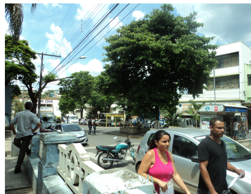
Pará de Minas - E. E. Governador Valadares Prédios comerciais e delegacia ao fundo (foto 33) Imagem: Isabel Garcia-12/11/2013