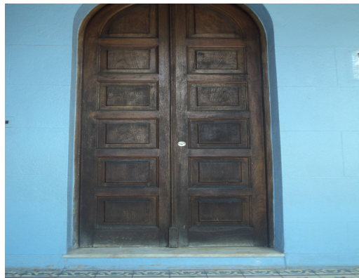
Pará de Minas - E. E. Governador Valadares Vista da porta (foto18) Imagem: Isabel Garcia-12/11/2013