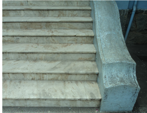
Pará de Minas - E. E. Governador Valadares Detalhe trincas e perda de material(foto 25) Imagem: Isabel Garcia-12/11/2013