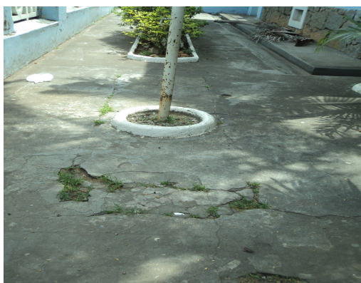
Pará de Minas - E. E. Governador Valadares Piso cimentado (foto 21) Imagem: Isabel Garcia-12/11/2013