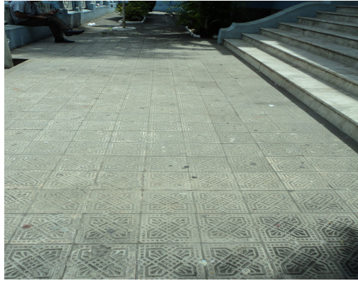
Pará de Minas - E. E. Governador Valadares