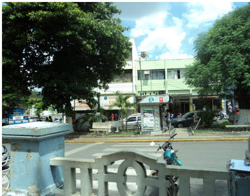
Pará de Minas - E. E. Governador Valadares Vista da praça Cônego Hugo em frente (foto 32) Imagem: Isabel Garcia-12/11/2013