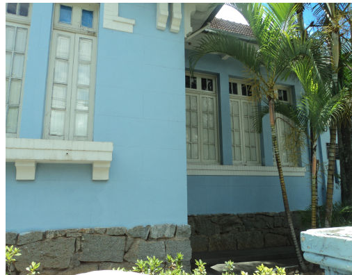
Pará de Minas - E. E. Governador Valadares Vista da alvenaria em bom estado (foto10) Imagem: Isabel Garcia-12/11/2013