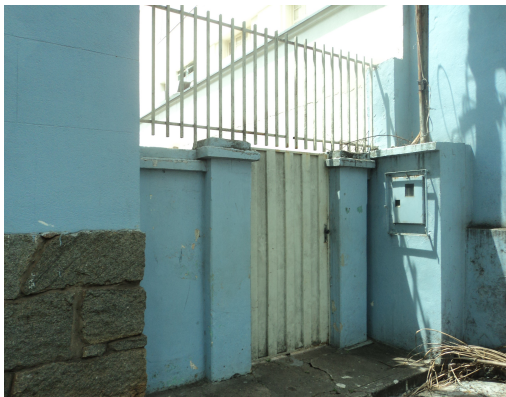
Pará de Minas - E. E. Governador Valadares Muro lateral direito (foto 26) Imagem: Isabel Garcia-12/11/2013