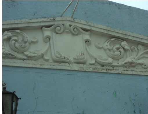
Pará de Minas - E. E. Governador Valadares Detalhe de elemento artístico (foto 12)12/11/2013