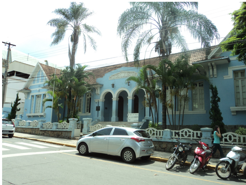
Pará de Minas - Escola Estadual Governador Valadares

EM CASO POSITIVO: LEI FEDERAL LEI ESTADUAL OUTRA