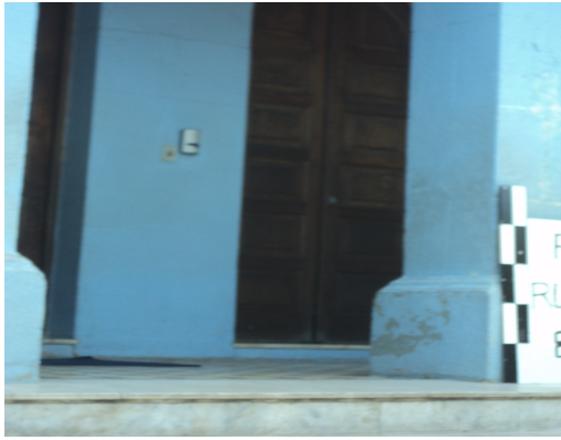
Pará de Minas - E. E. Governador Valadares Descolamento da pintura (foto 13) Imagem: Isabel Garcia-12/11/2013