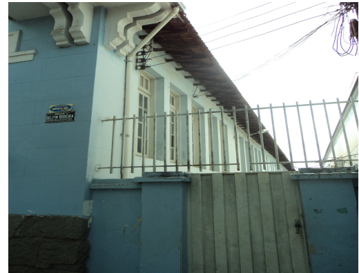
Pará de Minas - E. E. Governador Valadares Detalhe beiral simples (foto 07) Imagem: Isabel Garcia-12/11/2013