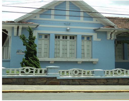
Pará de Minas - E. E. Governador Valadares Detalhe pintura externa. (foto 14) Imagem: Isabel Garcia-12/11/2013