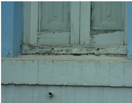
Pará de Minas - E. E. Governador Valadares Detalhe da janela (foto17) Imagem: Isabel Garcia-12/11/2013