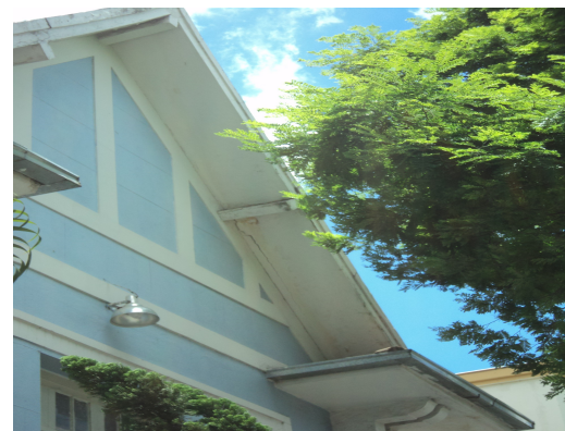
Pará de Minas - E. E. Governador Valadares Detalhe beiral –guarda pó em madeira (09) Imagem: Isabel Garcia-12/11/2013