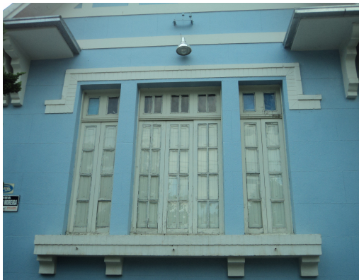
Pará de Minas - E. E. Governador Valadares Elemento Artístico (foto15) Imagem: Isabel Garcia-12/11/2013