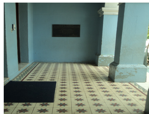
Pará de Minas - E. E. Governador Valadares Ladrilho hidráulico na varanda(foto 22) Imagem: Isabel Garcia-12/11/2013