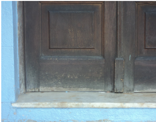
Pará de Minas - E. E. Governador Valadares Detalhe da porta (foto19) Imagem: Isabel Garcia-12/11/2013