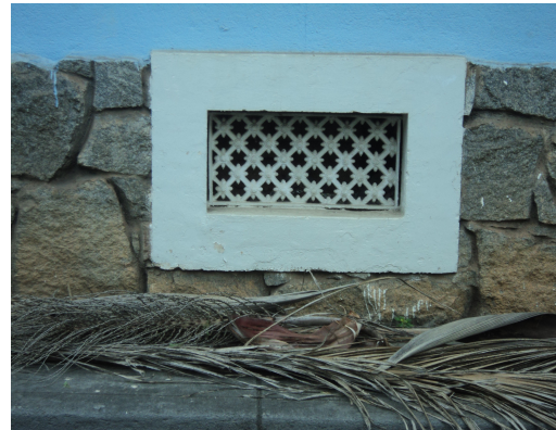
Pará de Minas - E. E. Governador Valadares Detalhe da grade metálica (foto 20) Imagem: Isabel Garcia-12/11/2013