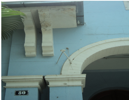
Pará de Minas - E. E. Governador Valadares Infiltração no beiral em laje (foto 06) Imagem: Isabel Garcia-12/11/2013