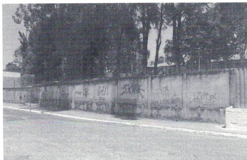
Muro da Quadra de Esportes de Tavares, localizada na rua São Francisco Distrito de Tavares de Minas - Pará de Minas - MG