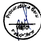
ELIAS DINIZ Prefeito de Pará de Minas