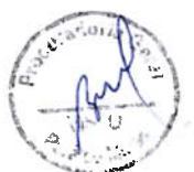
ELIAS DINIZ Prefeito de Pará de Minas